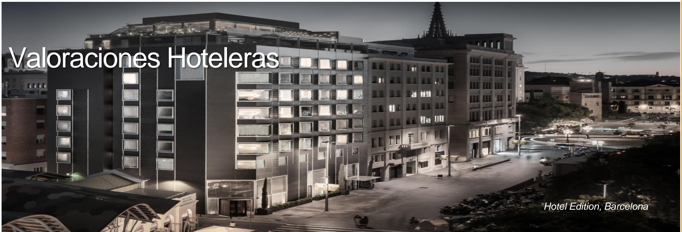
Hotel Edition, Barcelona