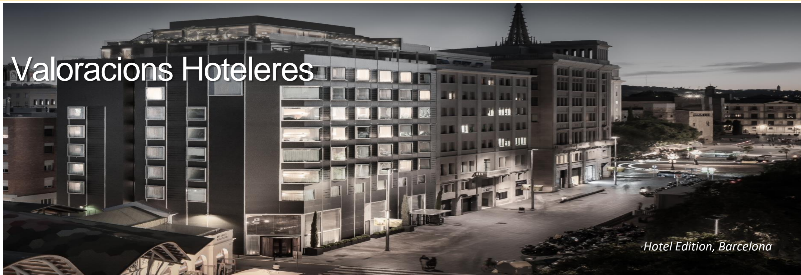
Hotel Edition, Barcelona